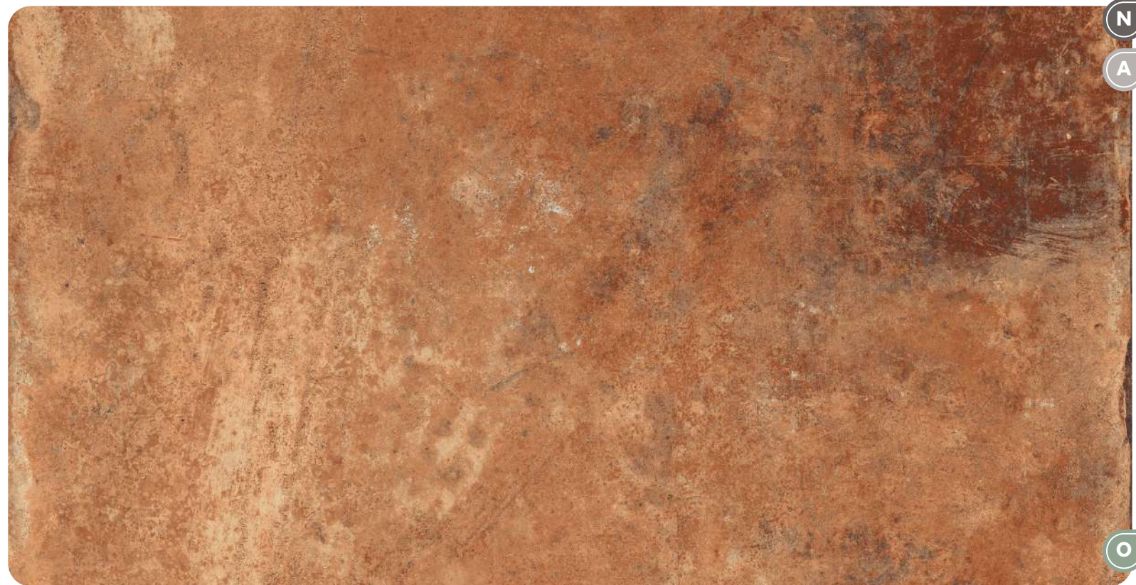
Rosso 9 MM - 20 MM