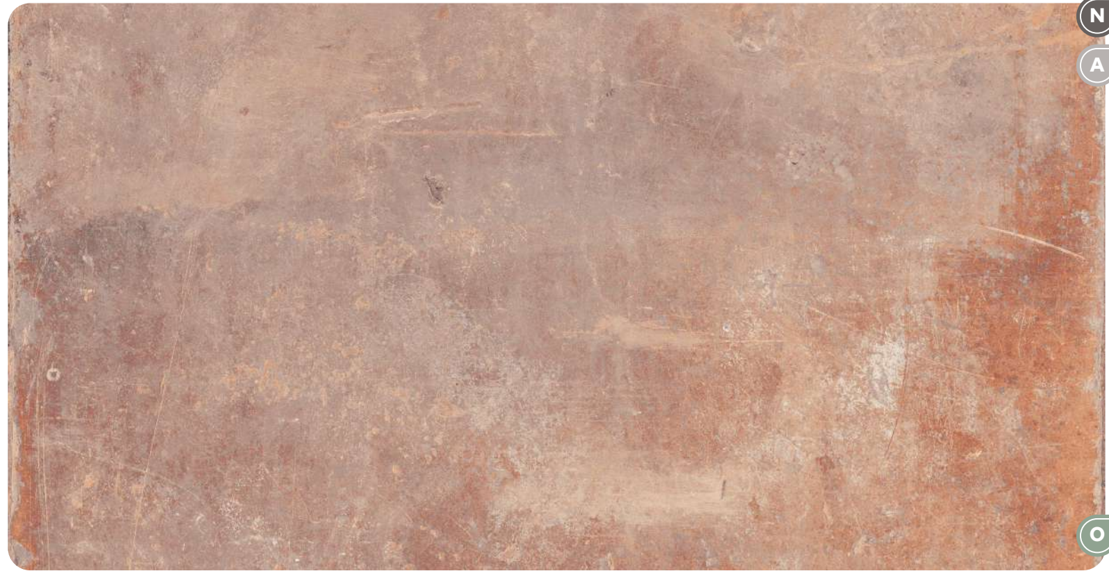
Rosato 9 MM - 20 MM

Finishes: N Naturale - A Antislip - O OutWalk Thickness: 9 - 20 MM