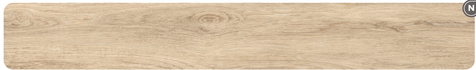
FINE - Flour 9,5 MM - 9 MM

NOOR FINE — Legno essenziale / Essential wood