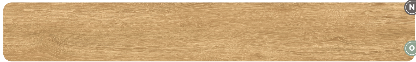
FINE - Amber 9,5 MM - 9 MM - 20 MM

NOOR BOLD — Legno espressivo / Expressive wood