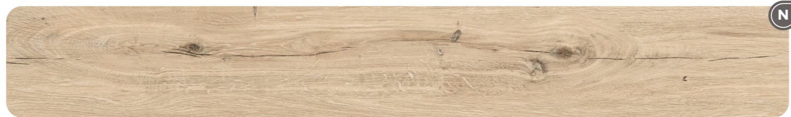
BOLD - Flour 9,5 MM - 9 MM

NOOR BOLD — Legno espressivo / Expressive wood