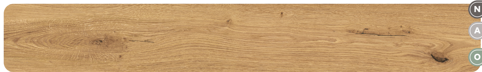
BOLD - Amber 9,5 MM - 9 MM - 20 MM