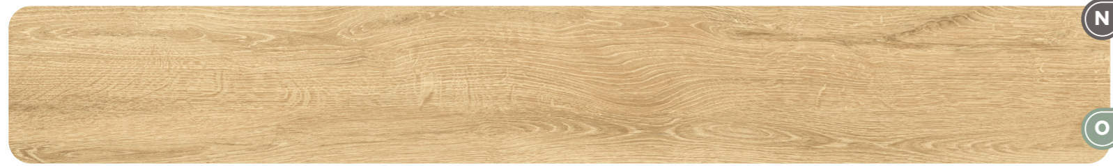
FINE - Grain 9,5 MM - 9 MM - 20 MM