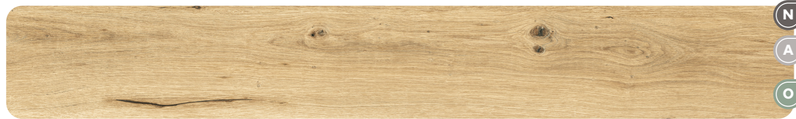
BOLD - Grain 9,5 MM - 9 MM - 20 MM