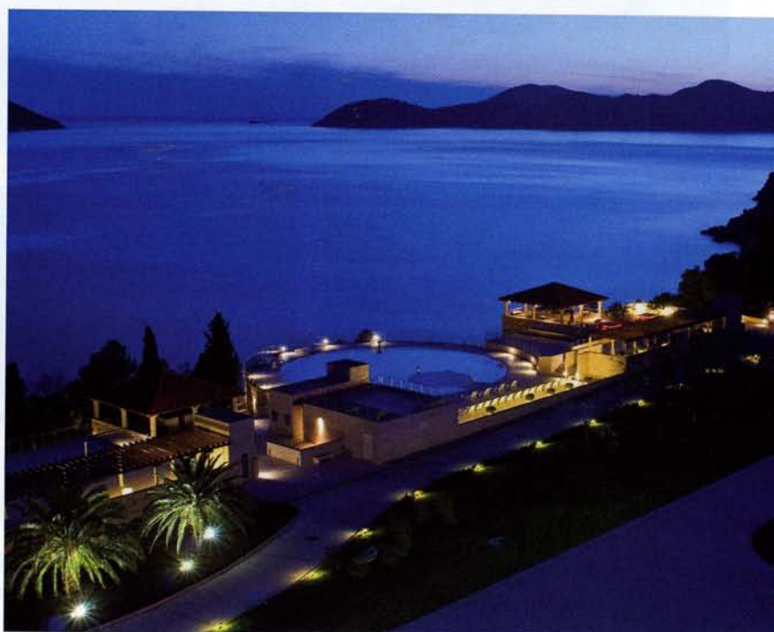
En haut , la cour intérieure, protégée par une légère structure métallique brise-soleil, est un espace inventif, une place urbaine définie par des murs et des parcours matériels, des jeux en fontaine sur un miroir d'eau. En bas à gauche , vu de la mer, le Radisson Blu Resort s'inscrit avec linéarité sur la pente de la côte dont il reproduit le relief. En bas à droite , les structures accessoires du complexe hôtelier se suivent en étages horizontaux qui descendent vers la mer, encadrant le paysage naturel.